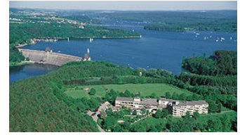
im Heinrich-Lübke-Haus der KAB Mönnesee-Günne